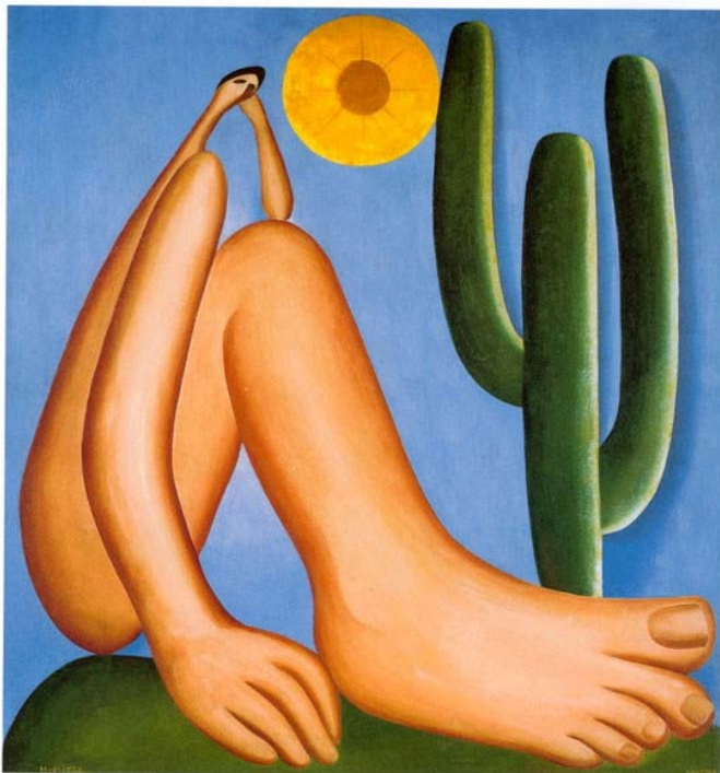
“Abaporu”. Tarsila do Amaral, 1928, Museo de Arte Latinoamericano de Buenos Aires, Argentina.