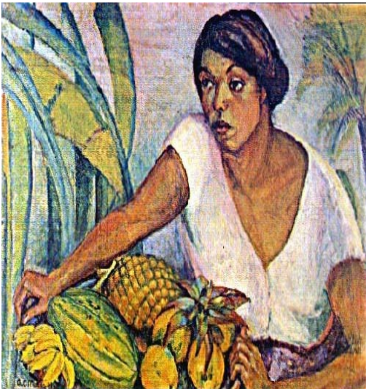
“Tropical”, Anita Malfatti, 1917. Pinacoteca del Estado de Sao Paulo.