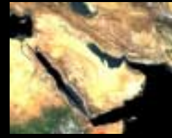
Departamento de Medio Oriente