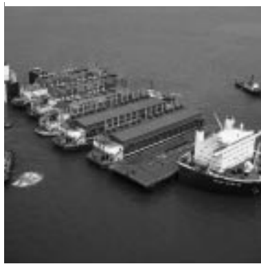
Con su programa de garantías, el OMGI prestó apoyo a un proyecto que permitió a un inversionista de Singapur transportar generadores de emergencia cargados en barcasas al nordeste de Brasil para paliar la grave escasez de electricidad provocada por la sequía.

Creado en 1988 ■ 162 países miembros Total acumulado de garantías 1 otorgadas: $12.400 millones Garantías otorgadas en el ejercicio de 2003: $1.400 millones