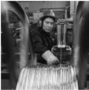
La CFI brinda financiamiento a Tecnofil de Perú para ayudar a la compañía a mejorar sus procesos de fabricación de productos de cobre.

Creada en 1956 ■ 175 países miembros Cartera de compromisos: $23.400 millones (incluidos $6.600 millones en préstamos de consorcios) Compromisos del ejercicio de 2003: $3.900 millones en 204 proyectos de 64 países