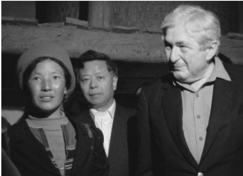
Durante su visita a China en mayo de 2002, el Sr. Wolfensohn asistió a un acto para celebrar la incorporación del país a la Development Gateway Foundation, en calidad de miembro fundador. Asimismo, puso en marcha el Portal Chino de Desarrollo junto con altos mandatarios del Gobierno chino.

El año pasado se ha caracterizado por una inquietud y una incertidumbre extraordinarias en todo el mundo, en particular como consecuencia de la persistente desaceleración económica, el conflicto de Iraq y los efectos de una nueva enfermedad, el síndrome respiratorio agudo severo (SRAS). En ese contexto, es más importante que nunca colaborar con nuestros asociados en la tarea del desarrollo para redoblar los esfuerzos orientados a reducir la pobreza en el mundo.