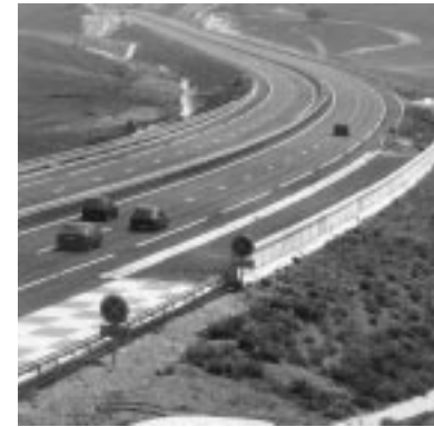
Un proyecto de construcción de carreteras es objeto de arbitraje ante el CIADI.

Creado en 1966 ■ 139 países miembros Total de casos registrados: 129 Casos registrados en el ejercicio de 2003: 26