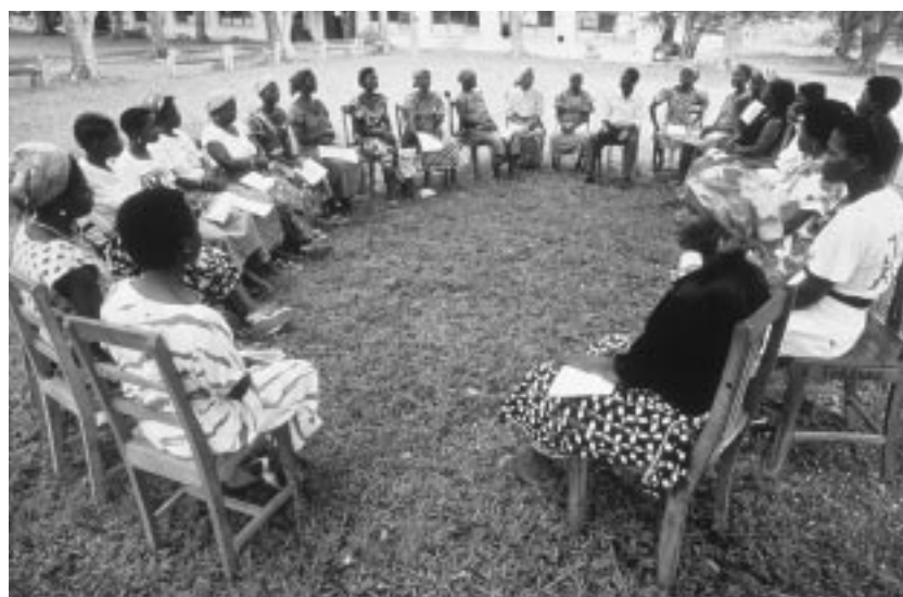
Las comunidades de Ghana conservan la tradición de organización y autogobierno, y tienen una experiencia en actividades comunitarias que puede favorecer su participación en el desarrollo general del país.

En el ejercicio de 2003, el Banco y el FMI prepararon en forma conjunta documentos sobre el gasto público y una actualización sobre la ejecución de los planes de acción de los países pobres muy endeudados, y colaboraron en la reforma de la administración pública. El Banco está elaborando una segunda generación de indicadores de la gestión de gobierno, junto con indicadores intermedios del avance de los proyectos relativos a dicha gestión. En este ejercicio se dictó por primera vez un importante curso básico sobre gobierno y lucha contra la corrupción. El Banco organizó, junto con Transparencia Internacional, una conferencia de un día de duración sobre los medios para aumentar la eficacia de la