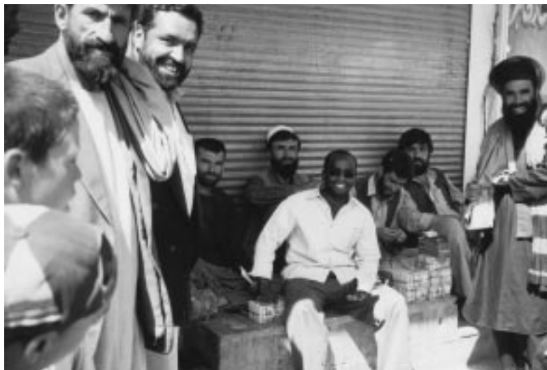
Mercado de cambios en Afganistán en 2002. El Banco Mundial llevó a cabo un estudio sobre sistemas informales de transferencia de fondos.

El Banco difunde activamente, por distintos medios, sus conocimientos y los resultados de sus investigaciones. Los Servicios de divulgación de conocimientos e información sobre el sector financiero, constituidos por un grupo de analistas de gran dedicación, actúan como centro de comunicaciones, investigación y recursos relacionados con temas del sector financiero para el personal del Banco