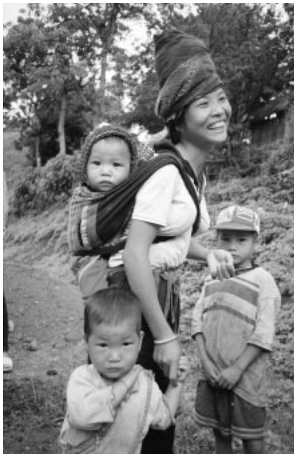
El objetivo de la Red sobre desarrollo humano del Banco consiste en aprovechar el conocimiento y la experiencia mundiales para mejorar la asistencia del Banco a sus clientes en los campos de la educación, la salud, la nutrición, la población y la protección social.

La iniciativa ha dado un lugar preponderante a la educación, ha reforzado el compromiso de los gobiernos y ha conseguido que se preste más atención a los resultados, por ejemplo, la terminación de la escuela primaria. Ha contribuido considerablemente a la coordinación entre los donantes, pues ha llevado a unificar el diálogo sobre políticas, ampliar la ayuda flexible para la educación primaria y adoptar normas eficaces en función de los costos para la construcción de escuelas.