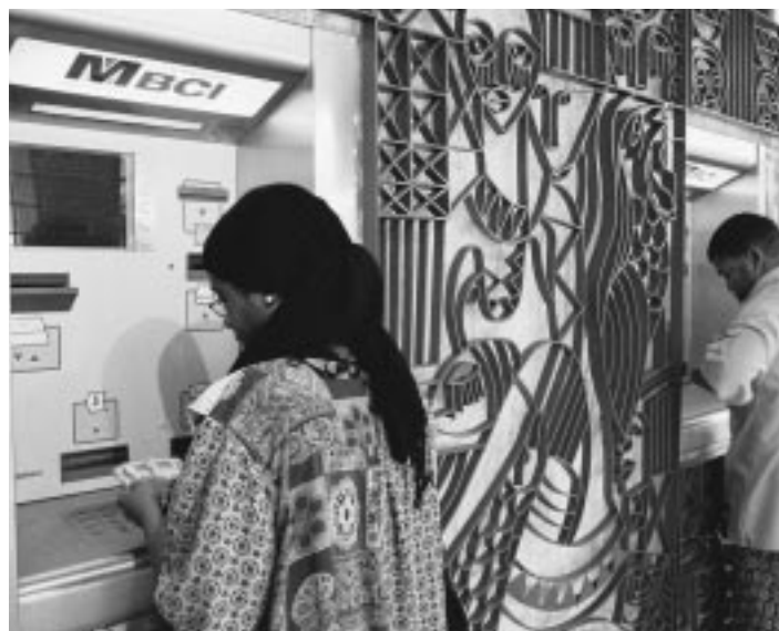
El desarrollo de la infraestructura financiera ha hecho más accesibles los servicios bancarios en África.

Con el objeto de contribuir a solucionar esos problemas, el Banco ha ayudado al BEAC (banco central de los citados Estados centroafricanos) a definir una importante reforma de la infraestructura de pagos. Aplicando un criterio participativo, el Banco ha respaldado un proyecto que contó con la intervención de todos los interesados y se financió en parte con un crédito de la AIF de $14,4 millones (el costo total del proyecto es de aproximadamente $22 millones). El Banco está ampliando el acceso a los servicios financieros en esta región, así como en otras donde se están llevando a cabo proyectos similares, mejorando la eficiencia de la infraestructura de pagos, tanto nacional como regional, y facilitando el acceso de las personas y la pequeña y mediana empresa a los servicios y medios de pago.