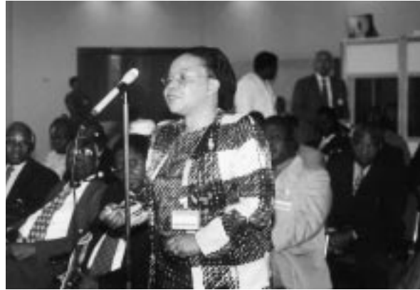
La jueza Effie Owuor, del Tribunal de Apelaciones de Kenya, interviene durante una de las sesiones de la Conferencia panafricana.

En el sector más amplio del derecho y la justicia, el Banco presta asistencia a los organismos encargados de la promulgación de las leyes, las comisiones de reforma legislativa, las asociaciones de abogados, las instituciones de enseñanza del derecho, la sociedad civil y los medios de difusión. En el área de la reforma legislativa, el Banco reconoce que muchos de los países clientes carecen de marcos jurídicos transparentes que favorezcan los incentivos de mercado apropiados y un acceso fácil y equitativo a los