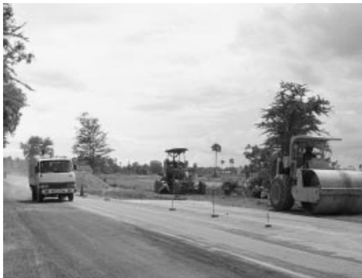
Construcción de una carretera en Camboya.

En la estrategia de desarrollo del sector privado también se propuso emplear, en forma experimental, métodos de ayuda basados en los resultados, para respaldar la prestación de servicios básicos, como infraestructura, salud y educación,