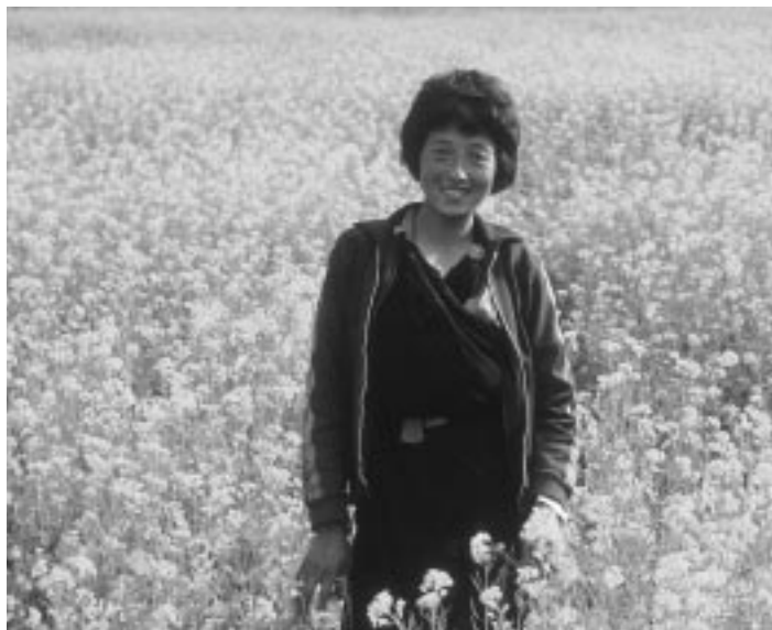
La comunidad internacional está renovando su compromiso con la reducción de la pobreza, necesidad imperiosa en el mundo en desarrollo. El Banco Mundial trabaja en aras del desarrollo sostenible, con la mirada puesta en el futuro para guiar las obras de hoy.

óptimas” mediante un examen del contenido ambiental de los DELP (por ejemplo, en el documento de la República del Yemen). El Banco también está incrementando la adopción de enfoques programáticos y el uso de instrumentos crediticios (por ejemplo, en el préstamo de ajuste estructural otorgado a México para la esfera ambiental) con el objeto de mejorar las políticas e instituciones relacionadas con el medio ambiente.