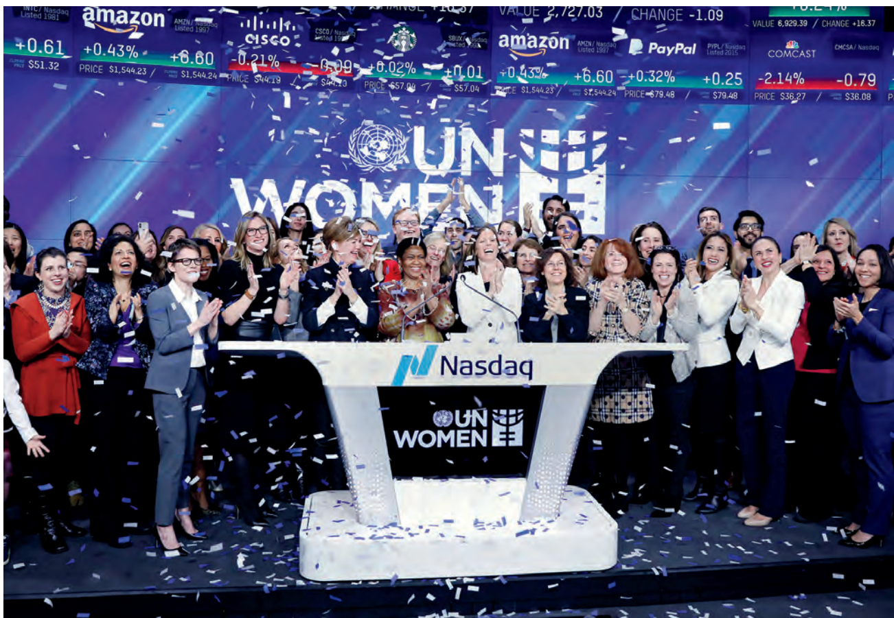
Para conmemorar el Día Internacional de la Mujer, las campanas de 63 mercados bursátiles del mundo sonaron para instar a las empresas a hacer su parte por la igualdad de género. La Directora Ejecutiva de ONU Mujeres Phumzile Mlambo-Ngcuka (centro, al frente) tañó la campana de cierre de jornada del Mercado de Valores Nasdaq, junto a la Presidenta y Gerente Ejecutiva de Nasdaq Adena Friedman (centro, a la derecha de la Directora Ejecutiva de ONU Mujeres).

En Nueva York, el tañido de la campana al cierre de la jornada del Mercado de Valores Nasdaq también marcó el intercambio de adhesiones a los Principios para el Empoderamiento de las Mujeres . Esta iniciativa de ONU Mujeres y el Pacto Mundial de las Naciones Unidas consiste en un conjunto de siete principios que brindan directrices prácticas a las empresas para promover la igualdad de género y el empoderamiento de