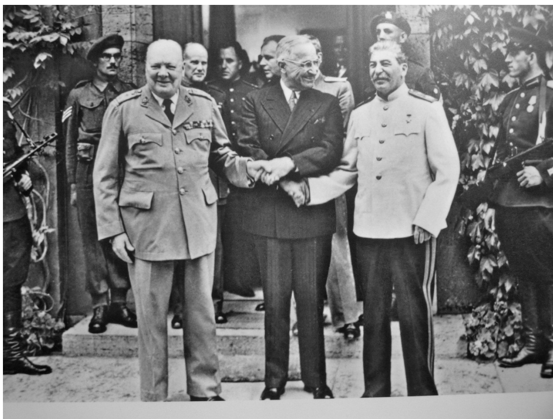
Winston Churchill -Harry S.Truman- Joseph Stalin

La primera de ellas fue la Conferencia de Yalta , en Crimea, que se produjo en febrero de 1945 y reunió a los líderes de la URSS, Joseph Stalin, del Reino Unido, Winston Churchill y de Estados Unidos, Franklin D. Roosevelt. Entre los temas que se discutieron estuvo la creación de las Naciones Unidas. La segunda fue la Conferencia de Postdam , Alemania, entre julio y agosto del mismo año, el representante de Estados Unidos en esta ocasión fue su nuevo presidente Harry S. Truman. En ella los líderes acordaron la futura administración de la derrotada Alemania tras su rendición y las cuestiones relacionadas con los acuerdos de paz.