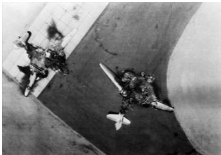
Aviones Mig-21 egipcios destruidos en su base tras un ataque israelí, el 5 de junio de 1967 4

Al encontrarse en considerable desventaja numérica, la estrategia utilizada por el Estado de Israel fue la de organizar un ataque preventivo, entendiendo que el factor sorpresa era la alternativa a la superioridad de sus enemigos. Fue así que en la madrugada del día 5 de junio llevaron a cabo la llamada Operación Foco , donde los cazas israelíes bombardearon y destruyeron gran parte de la aviación de combate egipcia que se encontraba en sus bases.