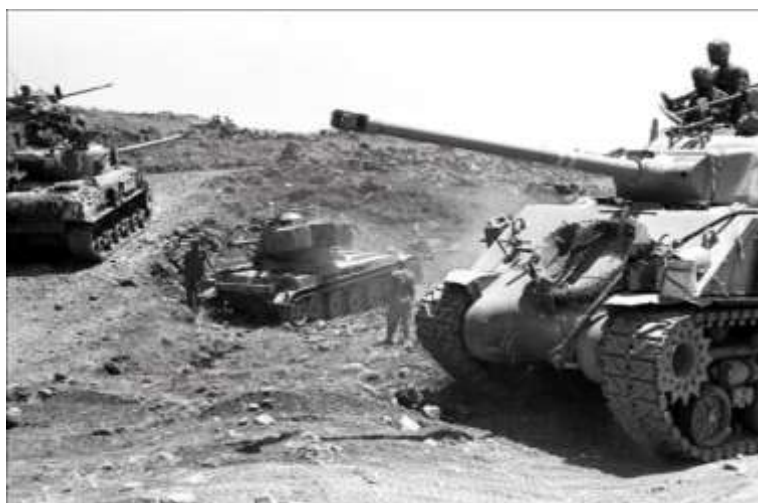
Tanques israelíes avanzan en los Altos del Golán (frontera siria)

En el contexto histórico general, donde el mundo se encontraba inmerso en el sistema bipolar de la Guerra Fría, las principales potencias enfrentadas tomaron partido. La URSS y el bloque socialista rompieron relaciones con Israel acusándolo por la ocupación de los territorios anexados en la guerra. Por otra parte, esos territorios se encontraban habitados por pobladores no judíos que se opondrían a su administración.